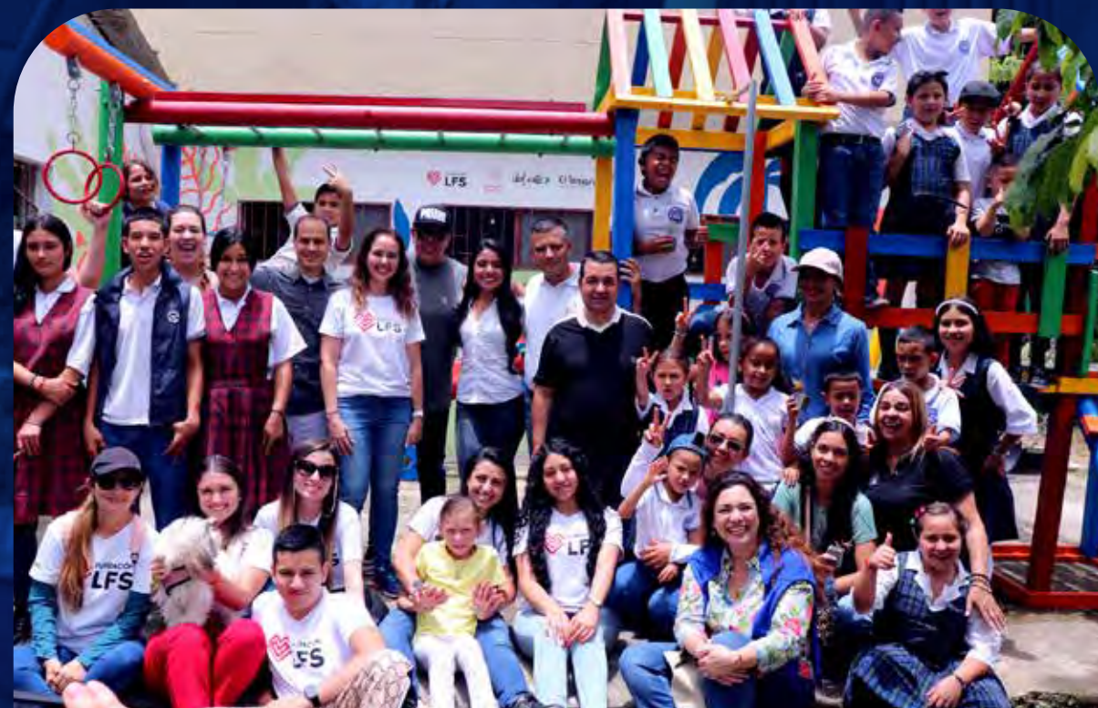
Ebéjico, Antioquia. Por: Fundación LFS, P.C El Tesoro, C.C. Del Este.