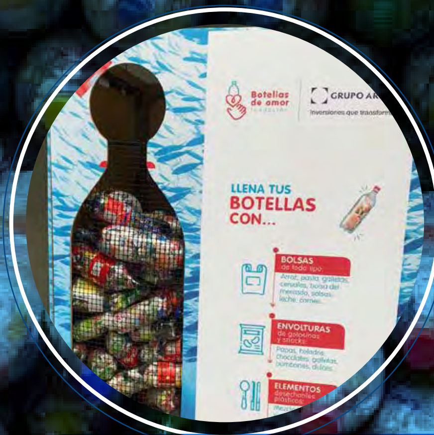
Grupo Argos, Medellín