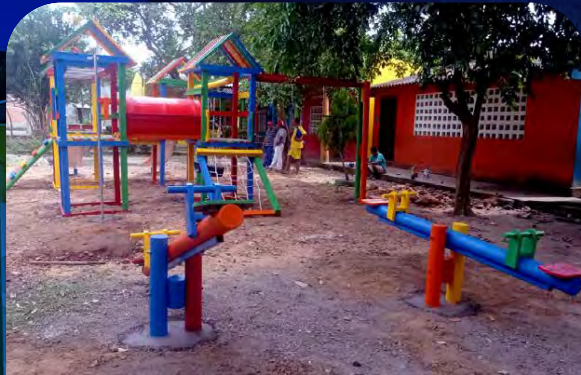
Cereté, Córdoba.