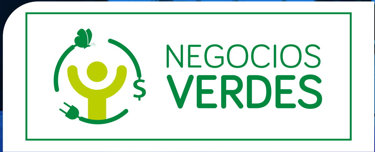
Certificado Negocio Verde