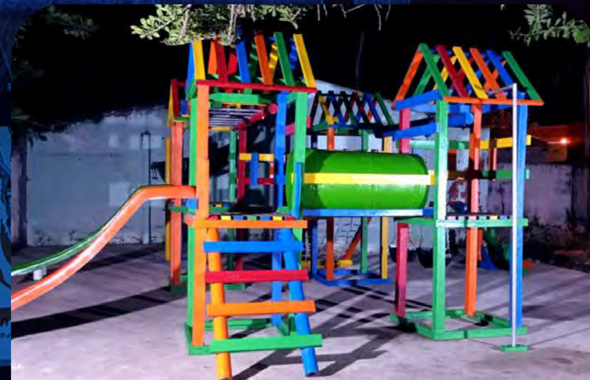
Cereté, Córdoba. Por: La Soberana