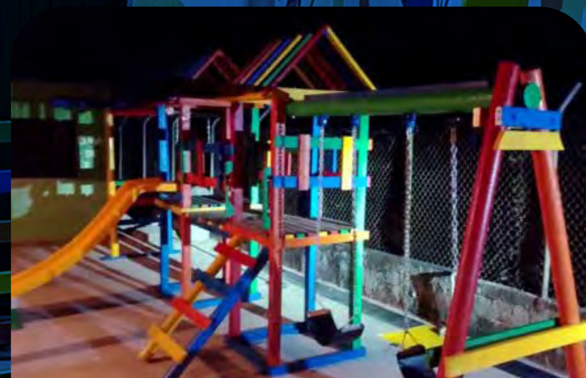
Cereté, Córdoba.