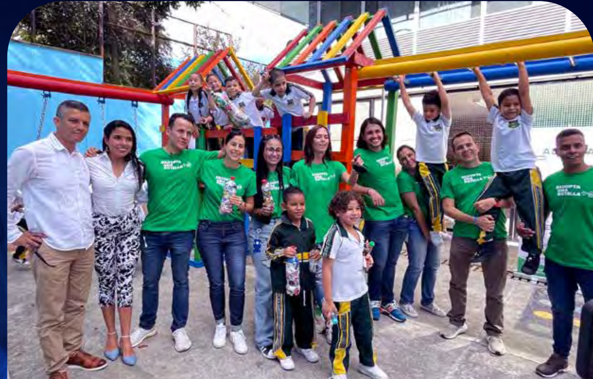
Medellín, Antioquia.