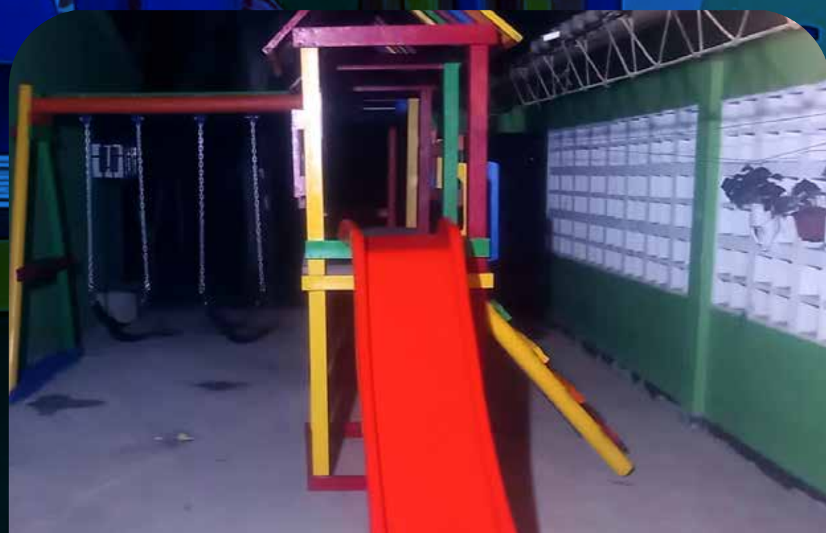
Cereté, Córdoba.