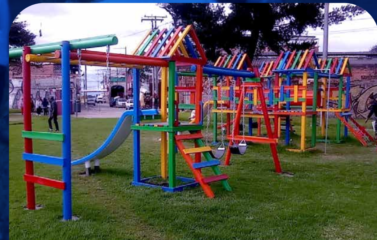
Cundinamarca Por: Aeropuerto El Dorado.