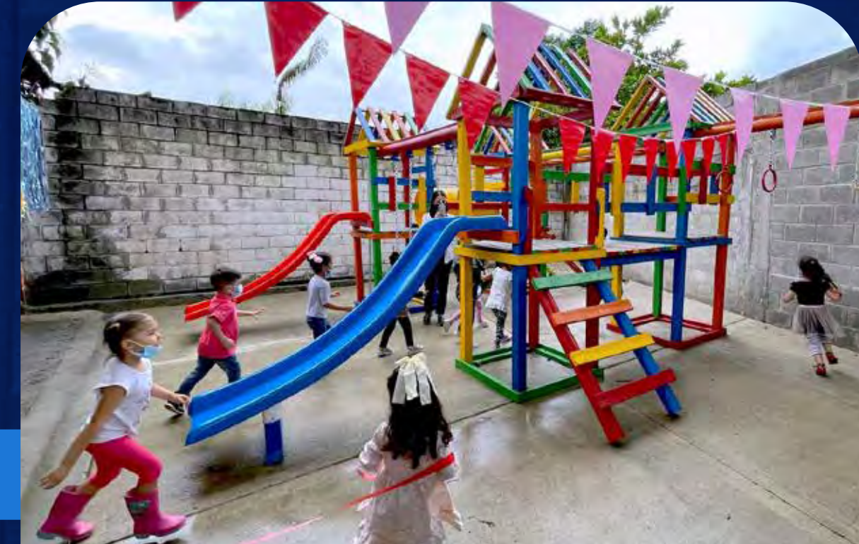
Medellín, Antioquia. Por: Alico