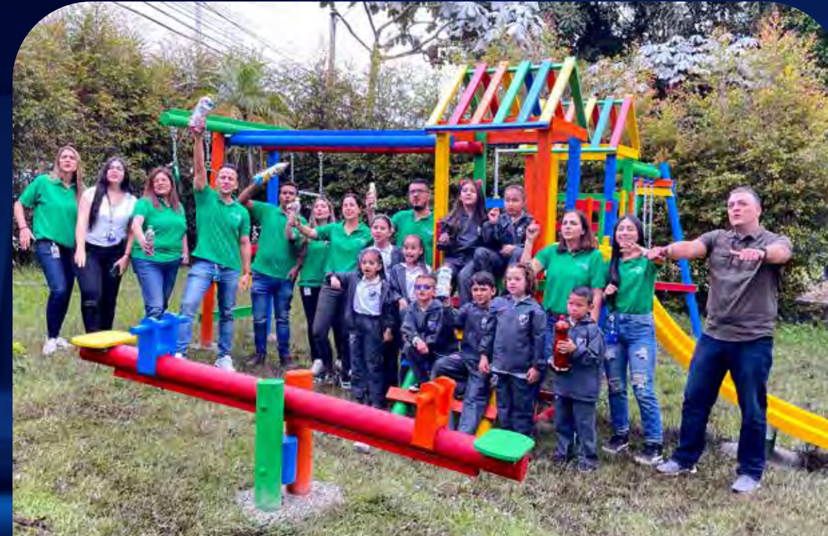
Tablazo, Antioquia. Por: Nutresa