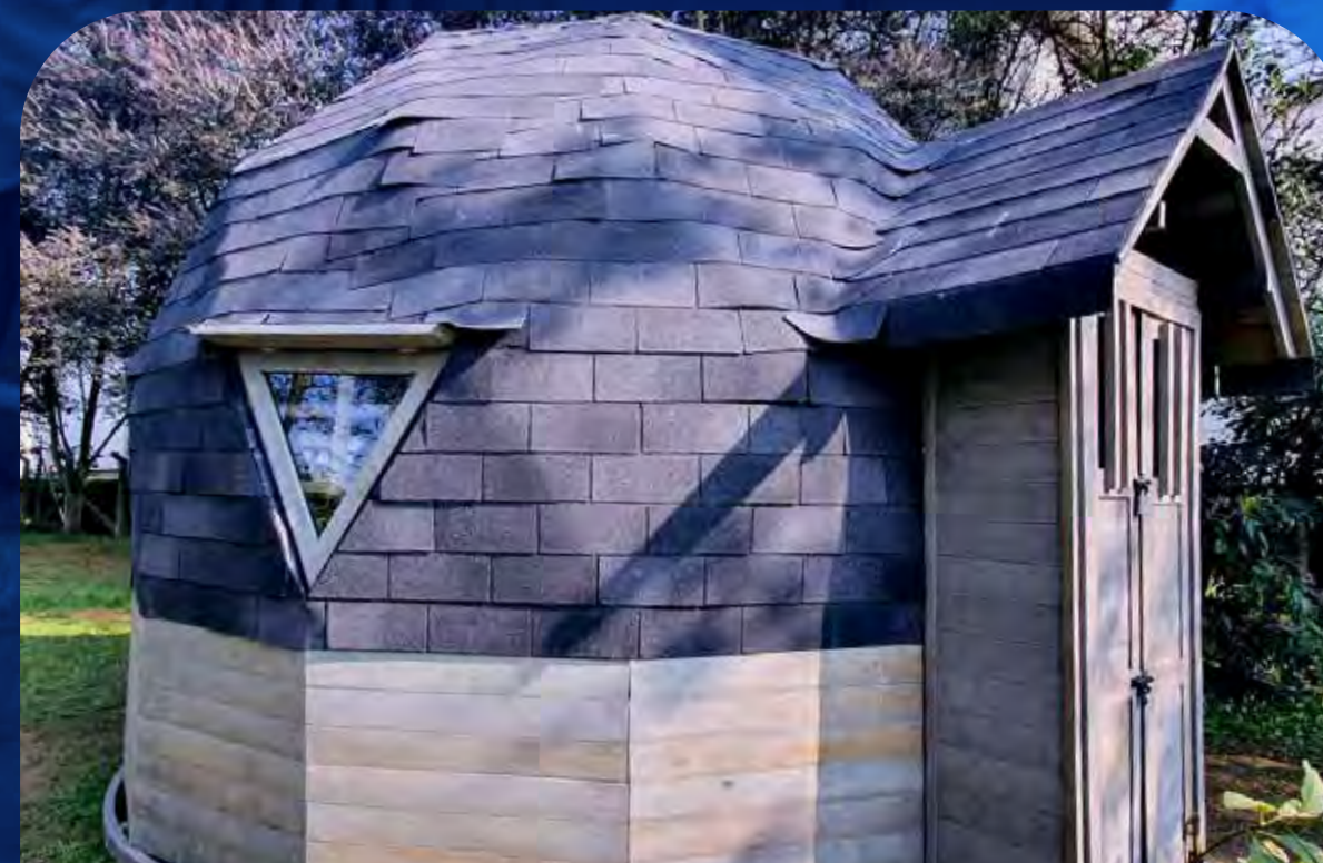
Funza, Cundinamarca. Por: Aeropuerto El Dorado.