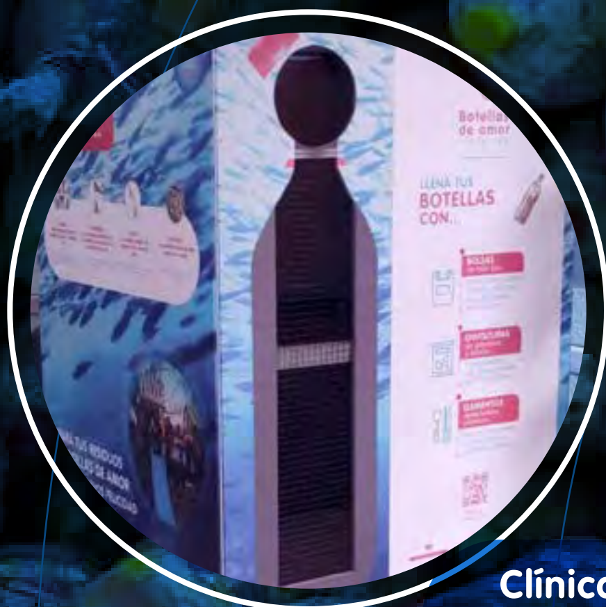
Clínica Victoriana - Sumi Medical, Medellín

Afianzamos el reconocimiento, fidelidad y proyección de marca a través de "cabinas de acopio Botellas de amor" compradas y donadas por entidades y empresas, para ser instaladas en acopios voluntarios, instituciones educativas y empresas.