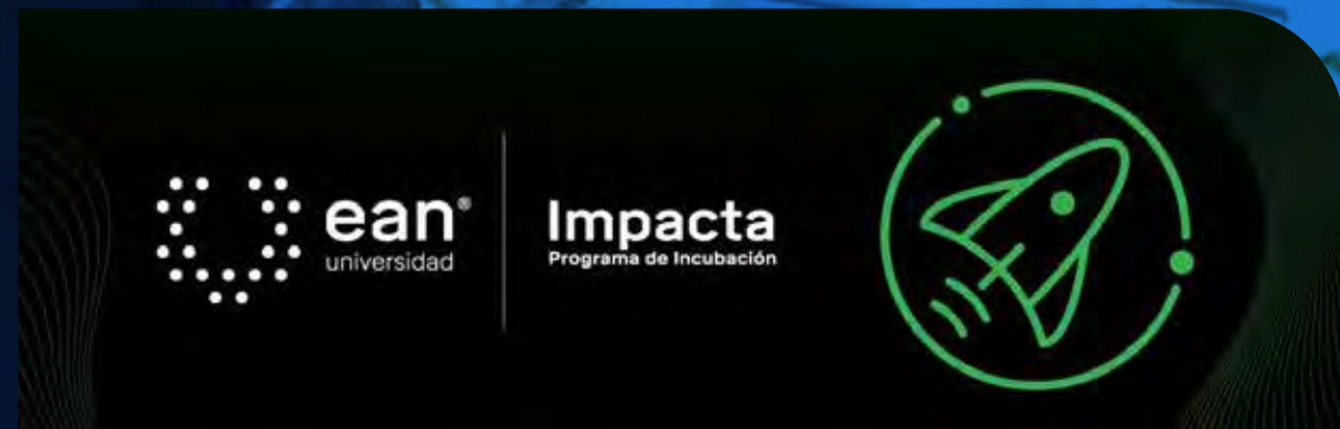
Premio de aceleración