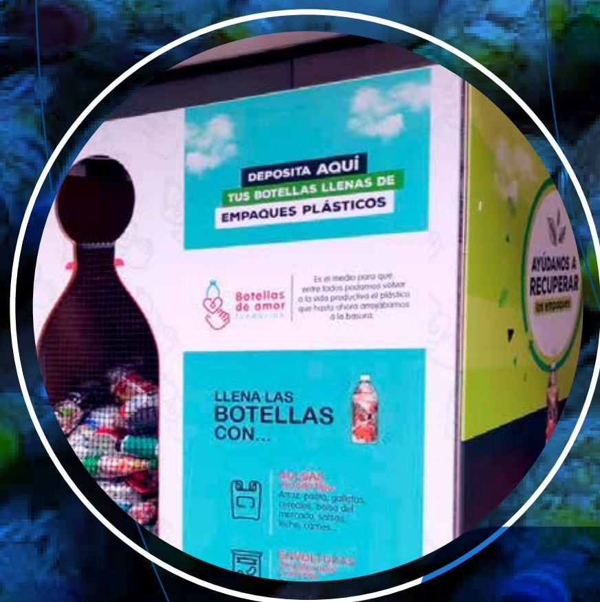
Nutresa, Torre Santillana, Medellín